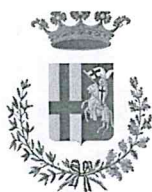
Città di Spoleto