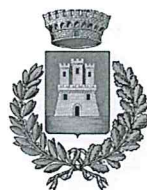
Comune di Vallo di Nera