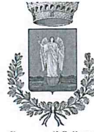
Comune di Sellano