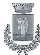
Comune di Sellano