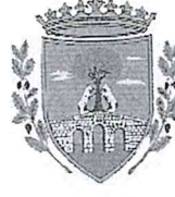
Comune di Cerreto di Spoleto