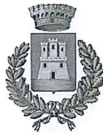
Comune di Vallo di Nera