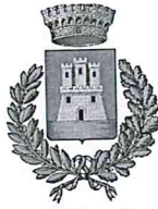
Comune di Vallo di Nera