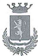
Comune di Norcia