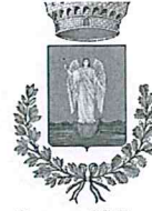
Comune di Sellano