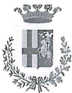
Città di Spoleto