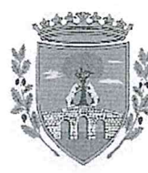
Comune di Cerreto di Spoleto