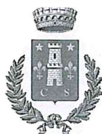
Comune di Scheggino