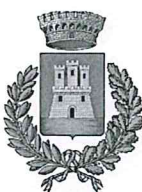
Comune di Vallo di Nera