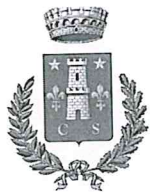
Comune di Scheggino