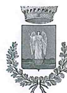
Comune di Sellano