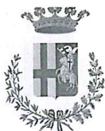
Città di Spoleto