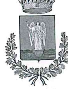
Comune di Sellano