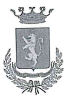
Comune di Norcia