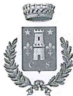
Comune di Scheggino